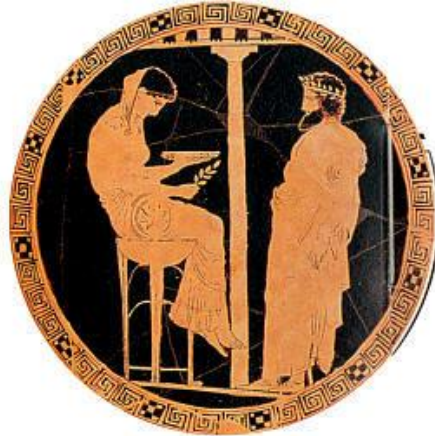
L'oracle de la Pythie

— Qu'est-ce qu'il y a d'inscrit à l'entrée du bureau ?